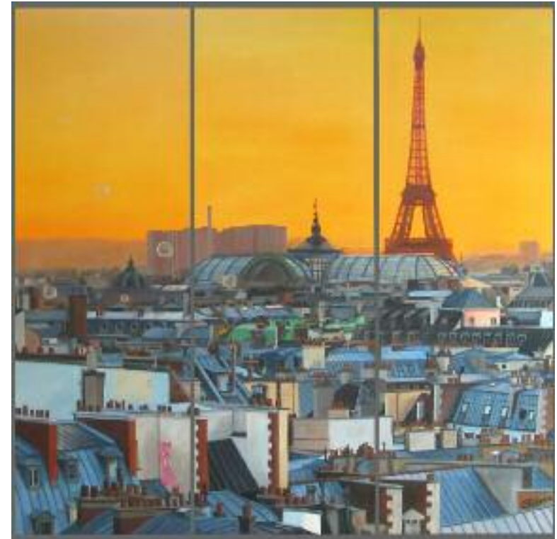
Paname Triptik , huile sur toile, 150x150 cm, 2016.