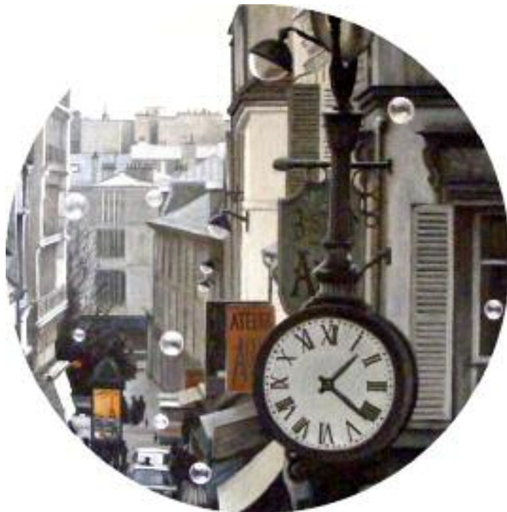
Avec le temps , huile sur toile, ronde 70 cm, 2017.

Grégoire nous offre des hommages aux moments de bonheurs, à ceux qu'elle aime, à ses coups de foudre qui ponctuent sa vie.