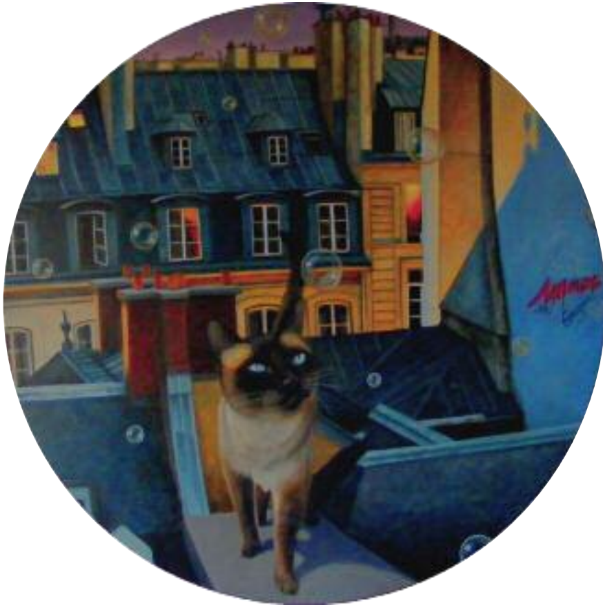
Novembre , huile sur toile, ronde 90 cm, 2016.

Gratuit pour les enfants et les demandeurs d'emploi Entrée gratuite pour tous le 1 er dimanche du mois.